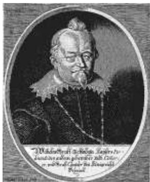
obrázek: Vilém Slavata z Chlumu a Košumberka