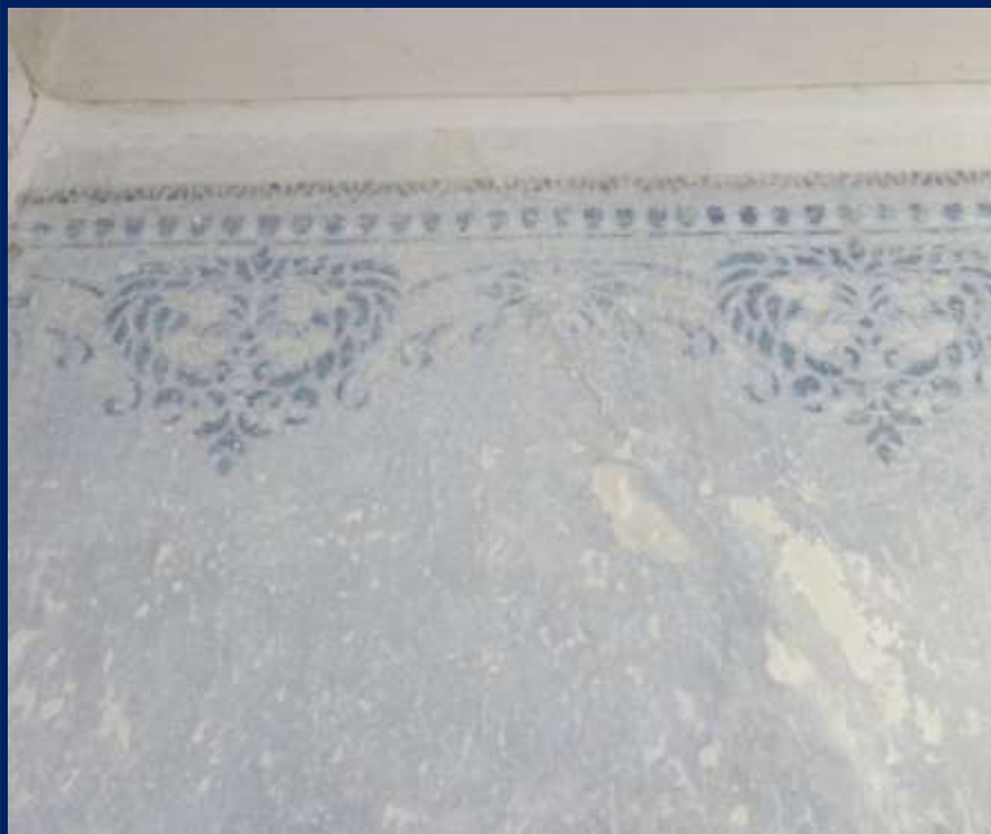
Detail nástěnné malby