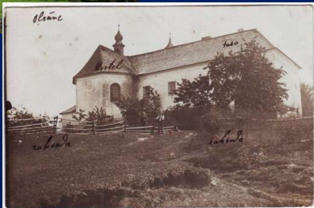
Kostel s farou na pohlednici ze začátku 20. století.