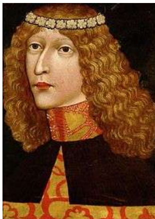
Ladislav Pohrobek, portrét neznámého autora z r. 1457

Pohrobek dítě narozené po smrti otce child born after father's death