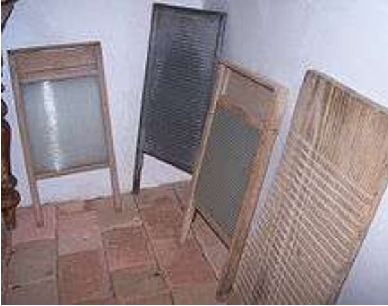
Valcha - Scrubbing board

Scrubbing board a simple tool used in the past to wash cloth