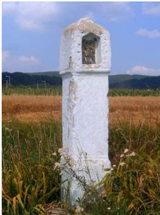
Boží muka ve Vřesovicích

drobná stavba nejčastěji ve tvaru sloupu nebo pilíře, někdy krytá stříškou it was built mostly in the form of a pillar or pillars, sometimes covered with a roof