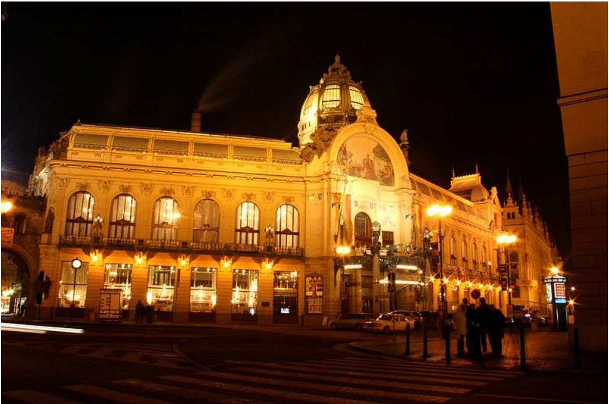
Obecní dům v Praze Municipal House in Prague

an artistic style in the 19th and 20 century