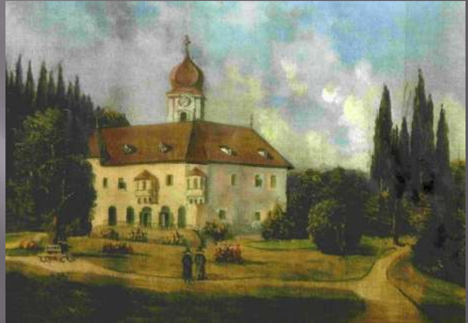
Zámek v 18. století.

Celková přestavba zámku byla dokončena r. 1864 a ta je prakticky shodná s dnešní podobou zámku.