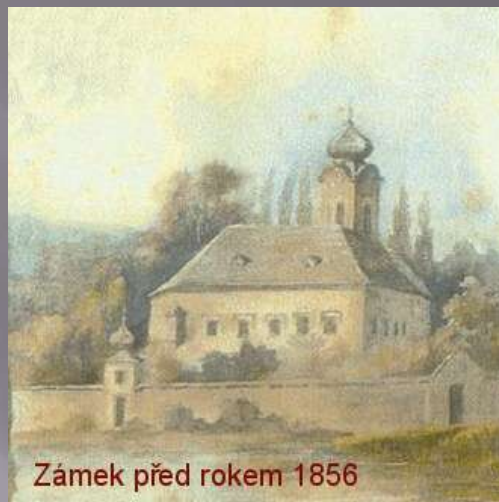
Zámek před rokem 1856

Od konce roku 1945 je zámek nevyužitý a nezabezpečený. Na základě Benešových dekretů byl tehdy veškerý majetek Reinhardtů konfiskován a patří státu.